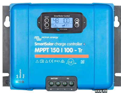
Contrôleur de charge SmartSolar MPPT 150/100-Tr avec un écran enfichable en option