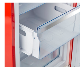
Plusieurs tiroirs faciles d'accès

Conçu pour optimiser les économies d'énergie, et d'une utilisation facile et fiable, le congélateur vertical CC Rétro Unique 175L UF allie un design classique de style rétro à des performances modernes. Ce congélateur vertical de 6,1 pi3 offre accès pratique aux 6 compartiments - Plus besoin de fouiller dans le congélateur à la recherche d'aliments.