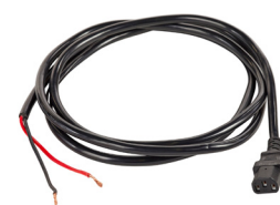
Cordon de 8 pi à extrémité ouverte inclus